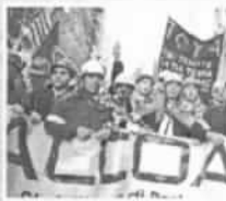
servizio a pagina 11

Alcoa: accolti a Civitavecchia i 56 dipendenti della Sardegna