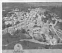
servizio a pagina 8

La città vuole gli spettacoli di Aglientu alla prossima Sagra