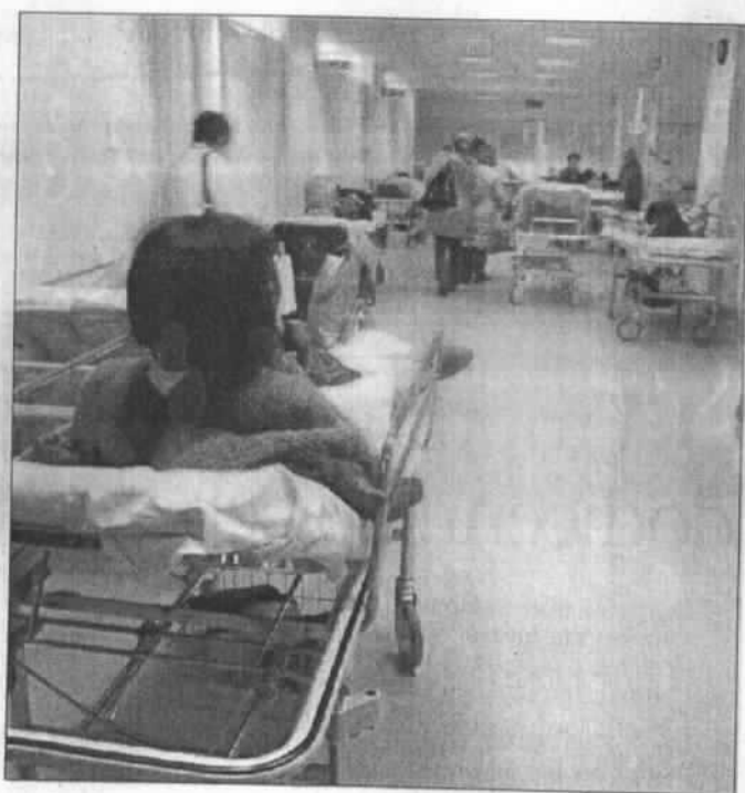
A sinistra una corsia d'ospedale; sotto la sede della Regione

Il linguaggio è burocratico, ma la sintesi è brutale: il Governo, o più correttamente il Tavolo tecnico di verifica dell'attuazione del piano di rientro, dice che per ora non sblocca i fondi per la Regione Lazio poiché ci sono ancora troppe inadempienze da parte della struttura commissariale (commissario per la sanità è il presidente Renata Polverini, con due sub-commissari nominati dal Governo). Nel dettaglio ecco uno stralcio del verbale: «In relazione al grave ritardo con cui la struttura commissariale sta procedendo nell'adozione dei provvedimenti di attuazione del piano di rientro, al mancato rafforzamento della governance regionale del sistema, al mancato rispetto delle prescrizioni dei ministeri affiancanti, Tavolo e Comitato confermano che non è possibile procedere ad erogare spettanze fino a quando la struttura commissariale non porrà in essere tutte le iniziative al fine di dare concreta e puntuale attuazione di quanto evidenziato». Detta così, sembra una bocciatura. Ma va tutto male? No, il tavolo tecnico evidenzia anche i buoni risultati ottenuti nel contenimento del disavanzo. Si legge ancora nel verbale: «A consuntivo 2011 la Regione presenta un disavanzo di 774,938 milioni di euro. Considerando l'eccesso di copertura derivante dal risultato di gestione dell'anno 2010 pari a