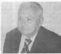
servizio a pagina 8

Le vie del sapere, presentato il nuovo libro dell'ing. Naso